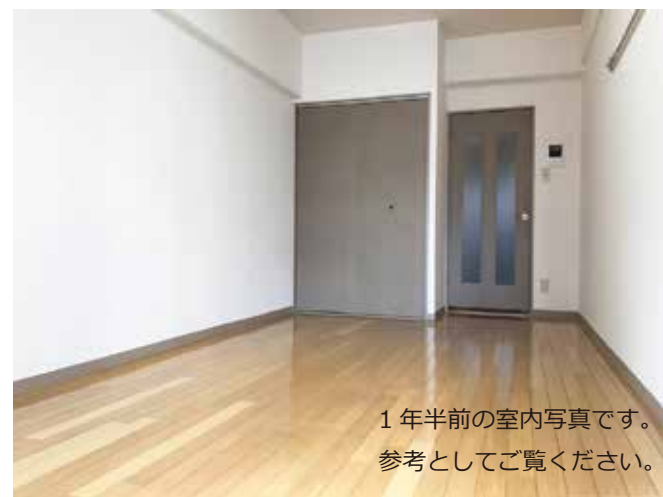
1年半前の室内写真です。 参考としてご覧ください。