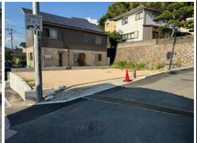
2024/9 撮影 (電柱移設済み)